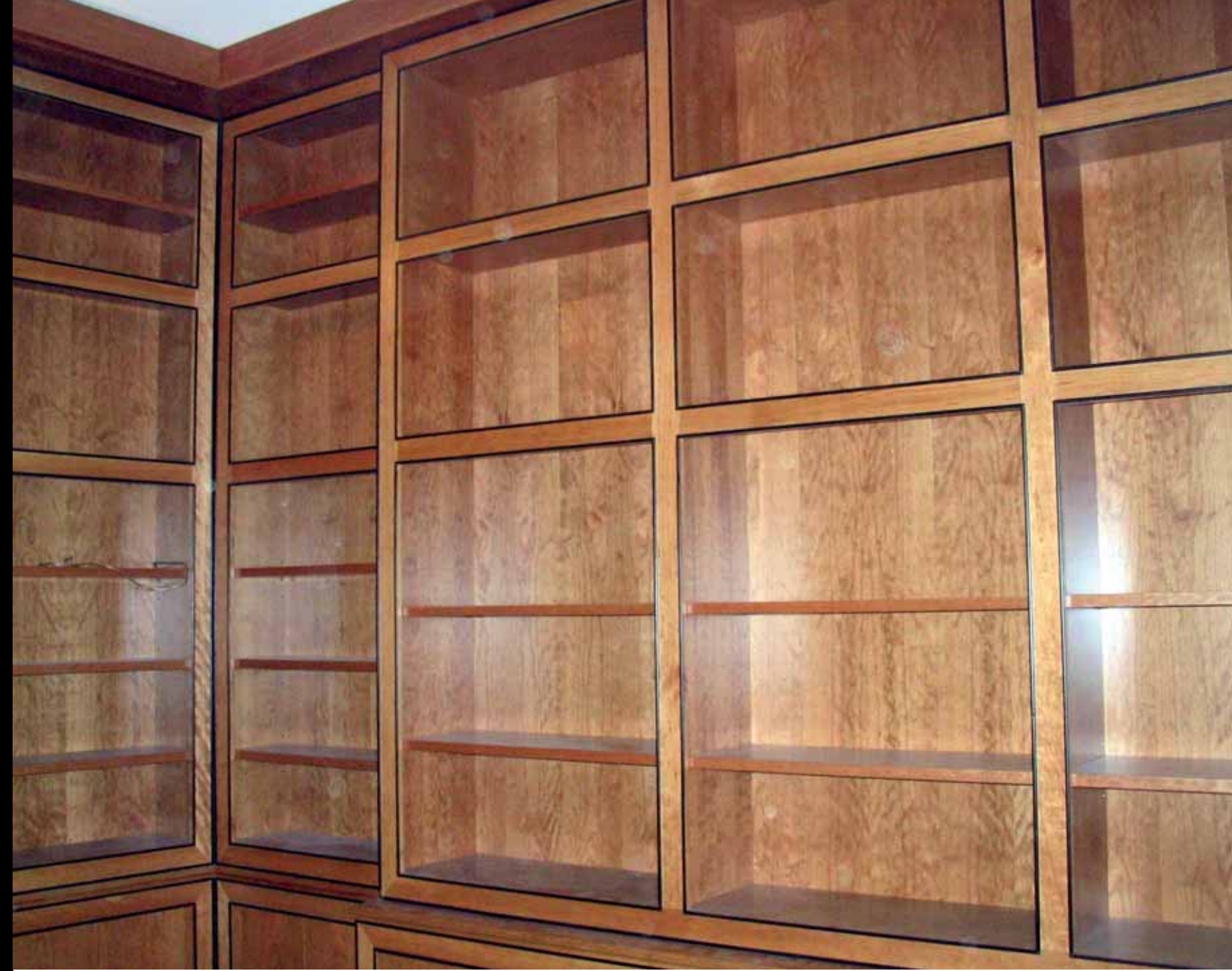
Libreria in ciliegio con inserti in ebano